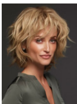
LACE FRONT / MONOFILAMENT / HAND TIED